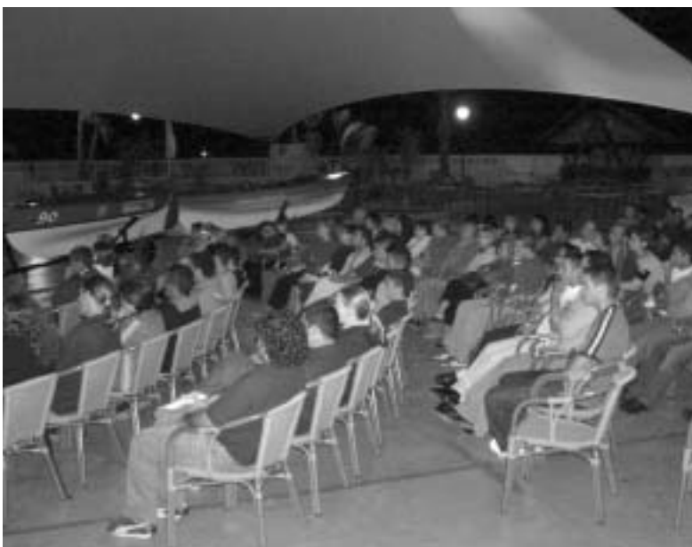
Cabildo de Fuerteventura. Consejería de Deportes